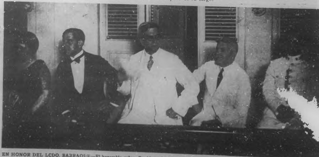
EN HONOR DEL LCDO. BARRAQUE.—El honorable señor Presidente de la República y su distinguida familia en el palco de honor del teatro "Nacional", presenciando el banquete allí ofrecido al Lcdo. Barraqué por el Colegio de Abogados.