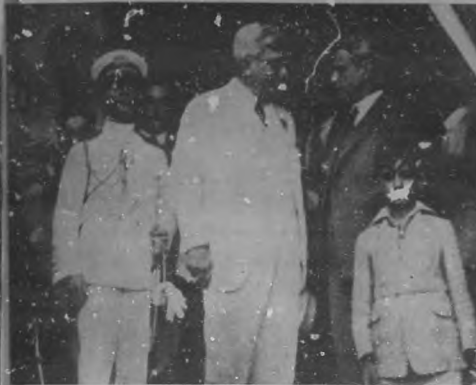
UN BUSTO AL GRAL. A. DEL CASTILLO.—A la izquierda: el honorable Presidente de la República, charlando con el alcalde de Guanabacoa, Sr. Masip, durante el acto de desvelar el busto del Gral. Adolfo del Castillo.—A la derecha: Un aspecto de la numerosa concurrencia que asistió al desvelamiento del busto del ilustre patriota general Adolfo del Castillo, en el parque de su nombre en Guanabacoa.