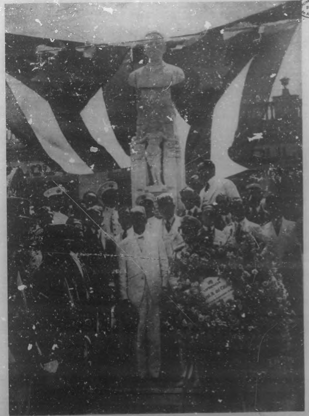
EN HONOR DE UN GRAN PATRIOTA.—Parte de la concurrencia que asistió a la inauguración del busto del general Adolfo del Castillo, en una de las plazas de Guanabacoa. En el grabado aparecen el general Machado, el general Pedro Betancourt, y varios altos funcionarios.