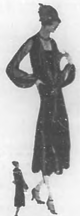
Muy moderno traje de seda con chorrera y mangas de chiffon.