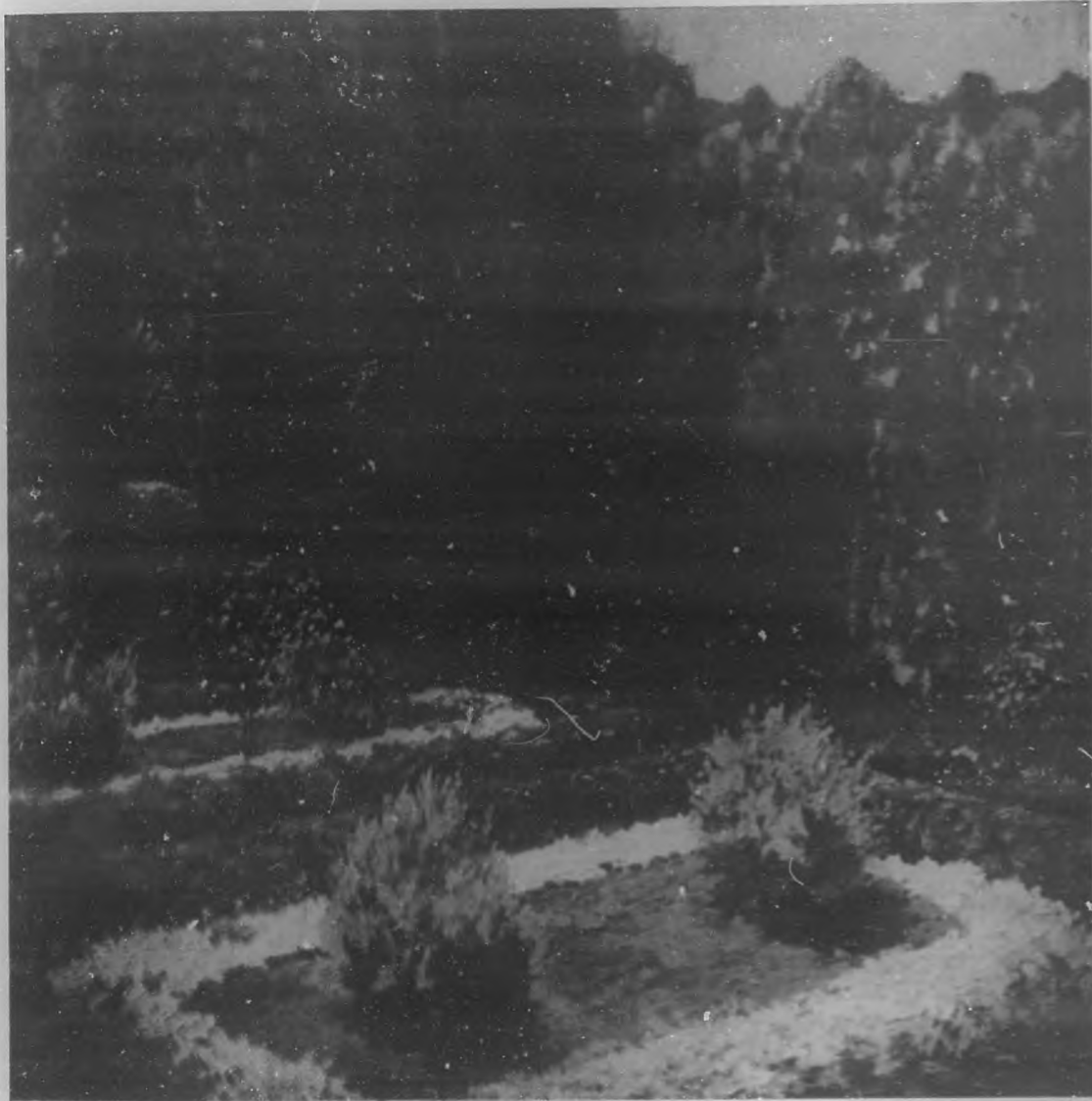
UN RINCON PROPICIO AL ENSUEÑO