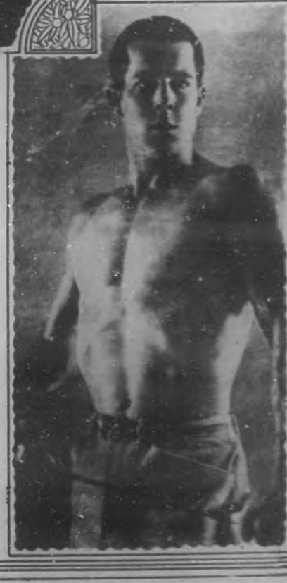
Reed Howes, el feliz sucesor de Wallace Reid, en un salto, en una de sus últimas producciones.