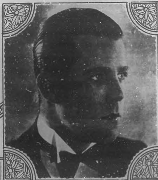
Reed Howes, simpático actor cinematográfico en el film "Noventa millas por hora".

No deje de ver a Reed Howes, el amante relámpago, el amante fantástico en sus velocidades en la cinta admirable y emocionante, de mucha acción, que se llama "Noventa Millas por hora" (A la Pág. 18).