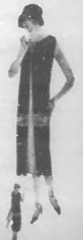
Modelo para jovenes. Túnica cerrada al frente. Entredós en la cadera.